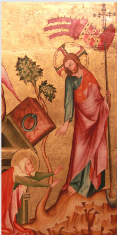
Noli me tangere (Ausschnitt) Klosterneuburg, 1331 Rückseite des Verduner Altares